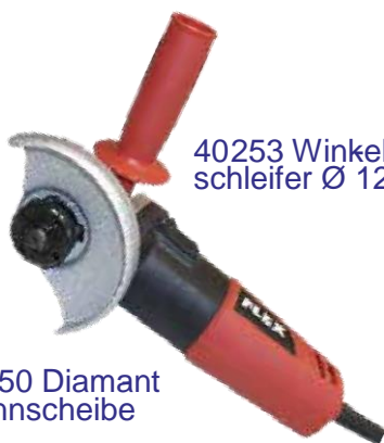
40253 Winkel schleifer Ø 125 mm