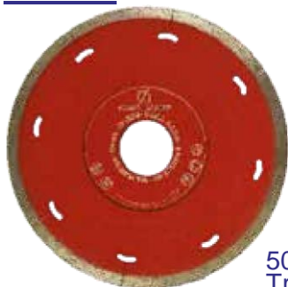
50250 Diamant Trennscheibe