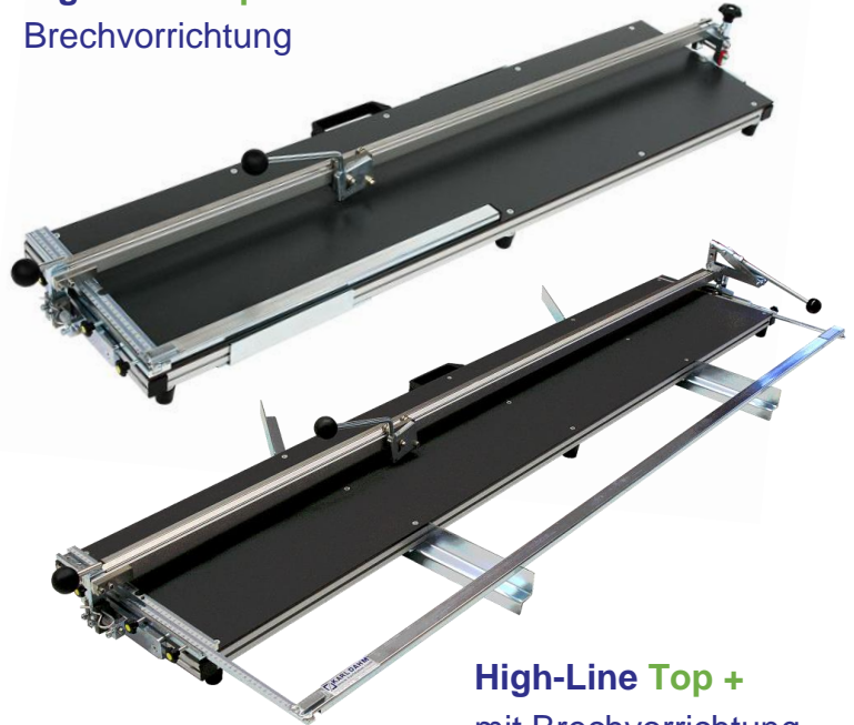
High-Line Top + mit Brechvorrichtung