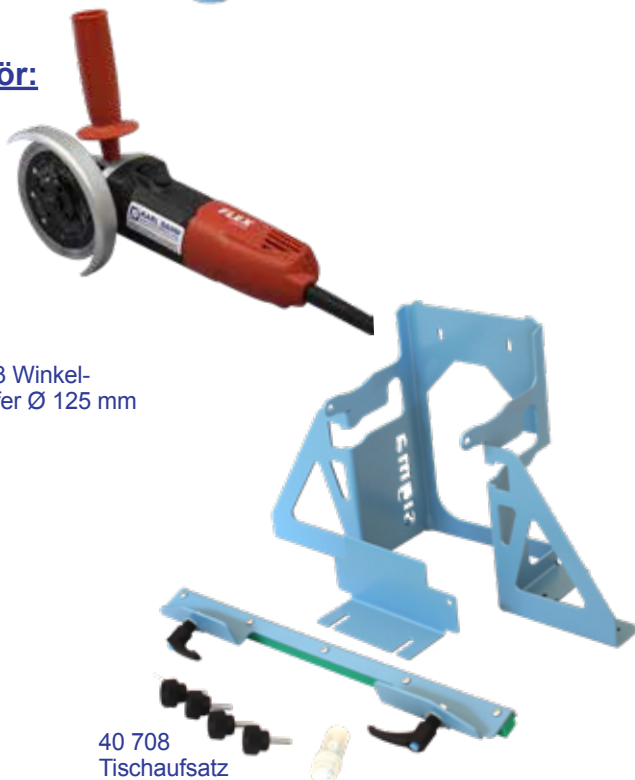
40 253 Winkel- schleifer Ø 125 mm