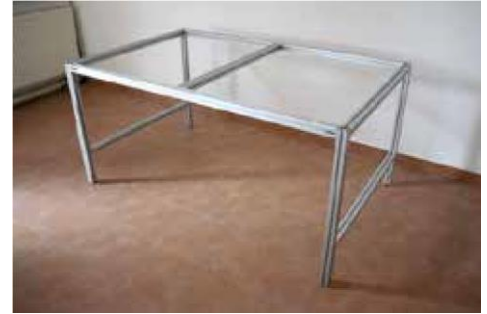
3.1 Auf der anderen Seite wiederholen