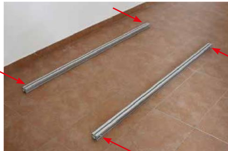
2. Die zwei Längsstreben (1) hinlegen, dass die Inbusschrauben außen sind