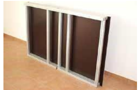
1.5 Der Tisch ist jetzt im und Transportzustand