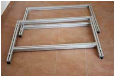
1.3 Vorgang wiederholen