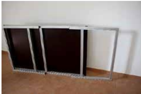
1.3 Seitenteile auf Oberteil aufschieben und festschrauben