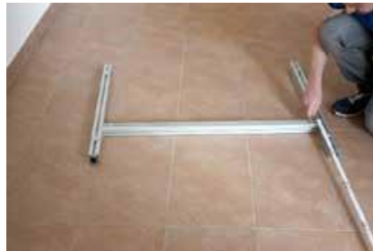
1.1 Querstrebe (3) einschieben und so hinlegen, dass die Inbusschrauben 20cm von der Unterkante