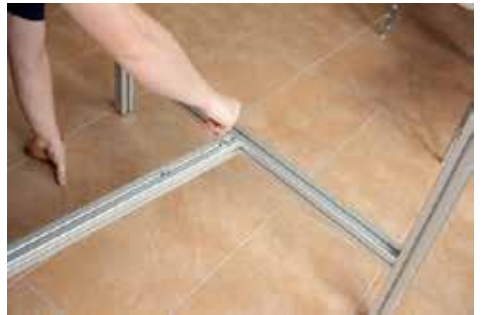
4.2 Mittig festschrauben