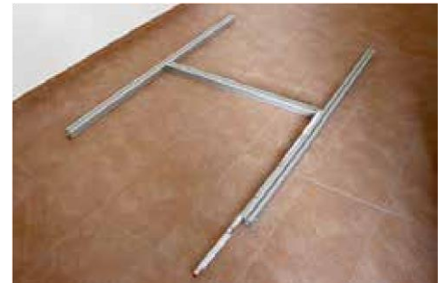
2.1 Querstrebe (3) einschieben und mittig bei 75 cm festschrauben

Für technische Beratung und Rückfragen Tel.: 08667 878-110