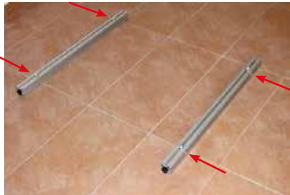
1. 1x Fuß links (4) und 1x Fuß rechts (5) so hinlegen, dass die Inbusschrauben