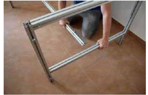
1.2 Mittelstrebe rechts und links lösen, 90° drehen und herausnehmen