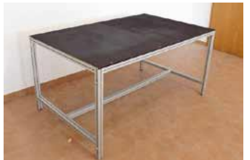
7. Der Tisch ist jetzt einsatzbereit