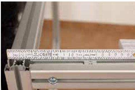
5. Nutensteine 13 cm vom Rand bzw. Mitte positionieren