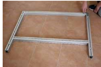
1.2 Zweite Querstrebe (3) einschieben und oben bündig festschrauben