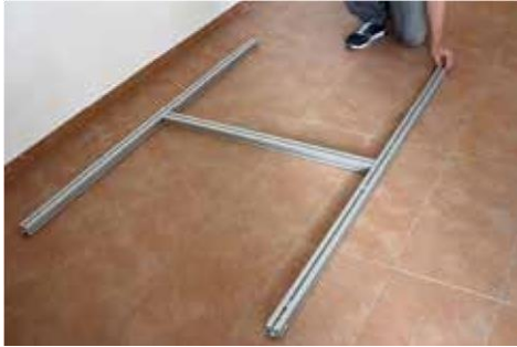
2.2 Umdrehen und auf jeder Seite oben 4 Nutensteine mit Feder (8) einlegen