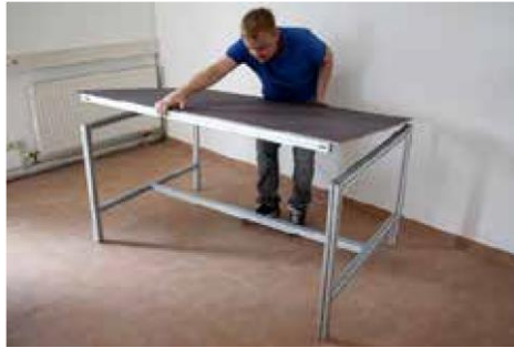
1.1 Tischoberteil abnehmen