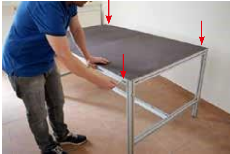
1. 4x seitliche Inbusschrauben lösen