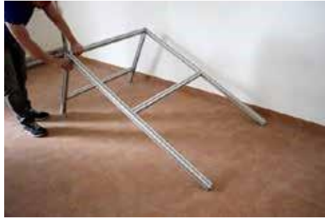
3. Oberteil oben bündig an Seitenteil festschrauben