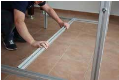
4.1 Mittelstrebe (2) so drehen, dass die Inbusschrauben oben sind