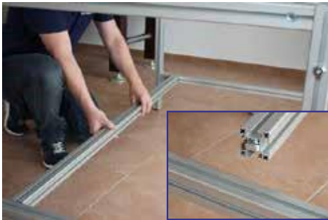
4. Mittelstrebe (2) seitlich einführen (Köpfe vorher ein wenig lösen)