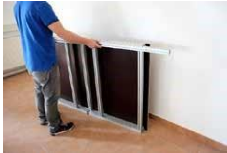
1.4 Mittelstrebe aufschieben und festschrauben