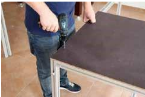
6. Tischplatten auflegen und die Schrauben mit dem Akkuschauber (4 mm Inbuseinsatz) verschrauben