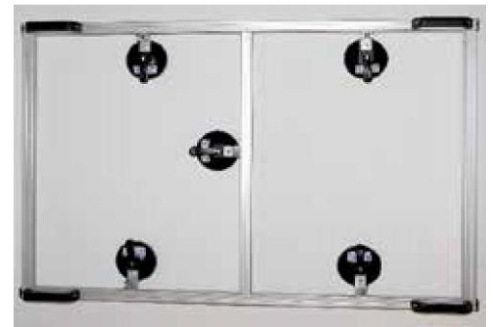
9. Art.-Nr. 12214 Hebe- und -