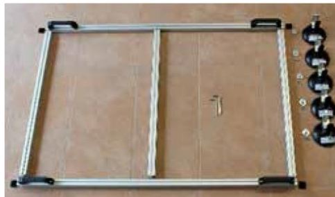
2. Auflegen des Montagerahmens