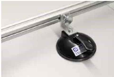
8. Saugheber mit Rändel- Verlegerahmen bis 120 cm