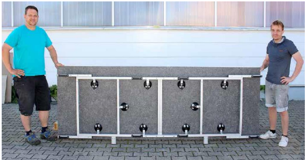
11. Fertiger Großformatrahmen Art. 12224