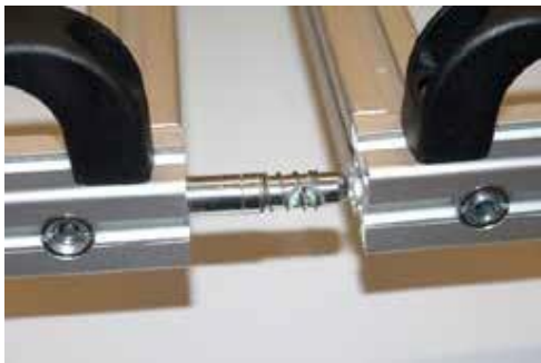
10. Einschieben und Verbinden der beiden Rahmenteile Art. 12214 zum Großformatrahmen Art. 12215