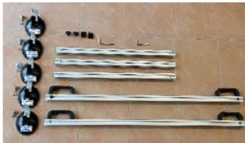
1. Lieferumfang zur Montage