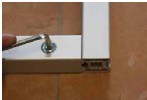
5. Mit Imbusschlüssel festziehen