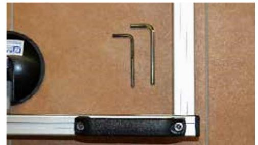
3. Werkzeuge für die Montage.