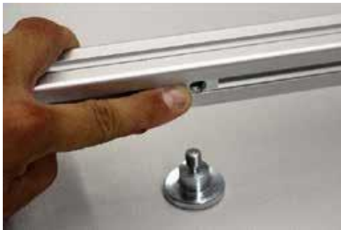
7. Gewindeeinsatz einsetzen schraube innen/außen montieren