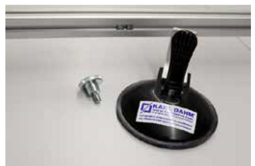
6. Saugheber zur Befestigung in der Profilschiene

Für technische Beratung und Rückfragen Tel.: 08667 878-110