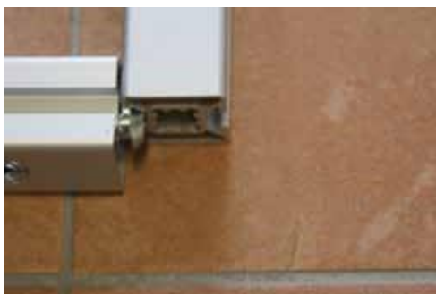
4. Eckverbindung ineinander schieben